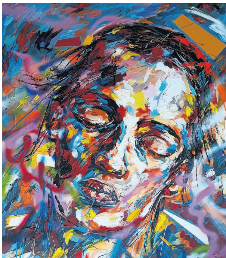
Una obra de la exposición titulada Cuando sueñas vuelas .

Adentrarse en la exposición Estratos supone la inmersión en una pintura llena de matices, hilos de colores, pinceladas gruesas, dibujos rectangulares o poli-