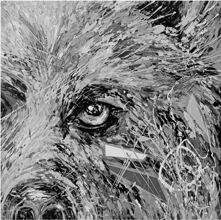
La profundidad de la mirada centra la obra titulada Lobo .