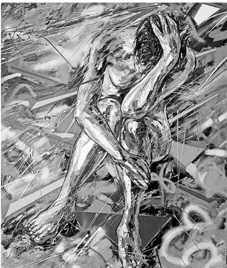
Diagonales y matices en la obra Espacio interior .