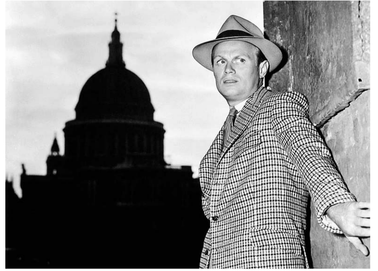
Richard Widmark en una secuencia de Noche en la ciudad .